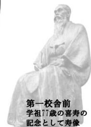
第一校舎前 学祖77歳の喜寿の 記念として寿像