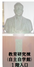
教育研究棟 (自主自学館) 1階入口

二代校長(初代学長) (昭和18年12月～昭和27年5月) 三代理事長 (昭和18年12月～昭和27年3月)